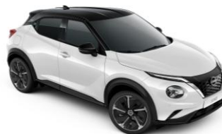
Gyöngyházfehér/ Fekete (PULSE)* XKJ – 0 Ft