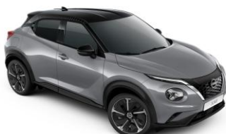
Gyöngyházzsürke/ Fekete (PULSE)* XEX – 0 Ft