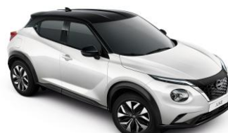
Gyöngyházfehér/ Fekete XKJ – 290 000 Ft