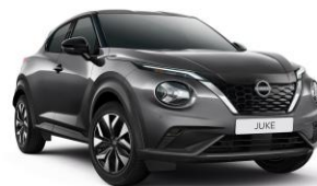
Szürke KAD – 160 000 Ft