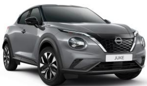
Gyöngyházzsürke KBY – 160 000 Ft