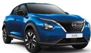
Élénkkék RCF – 160 000 Ft