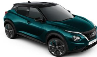
Mélyóceán/ Fekete (PULSE)* YBJ – 0 Ft