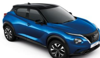
Élénkkék/ Fekete XGZ – 290 000 Ft