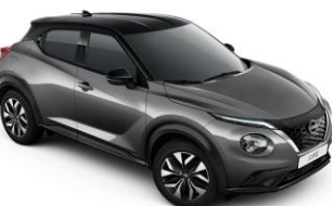
Szürke/ Fekete GAQ – 290 000 Ft