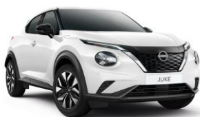
Fehér 326 – 70 000 Ft