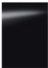
Fekete [GN0] M