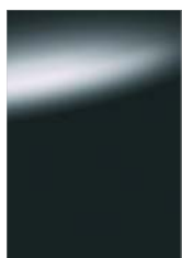
Szürke [K51] M