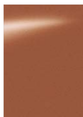
Bronz [CAQ] M