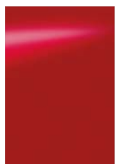
Piros [Z10] S