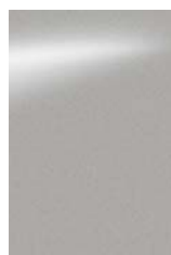
Ezüst [KLO] M