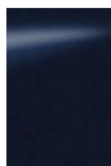
Sötétkék [BW9] M