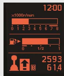
Fedélzeti számítógép sebességváltást segítő kijelzővel