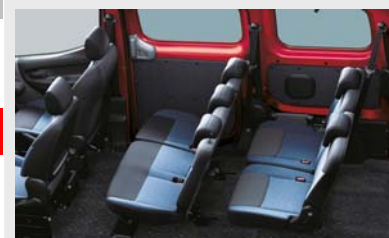
7 üléses változatban is kapható