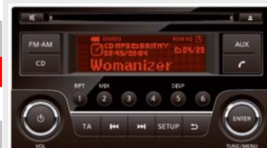
CD-MP3 lejátszó+FM/AM rádió+USB és AUX bemenet+Bluetooth